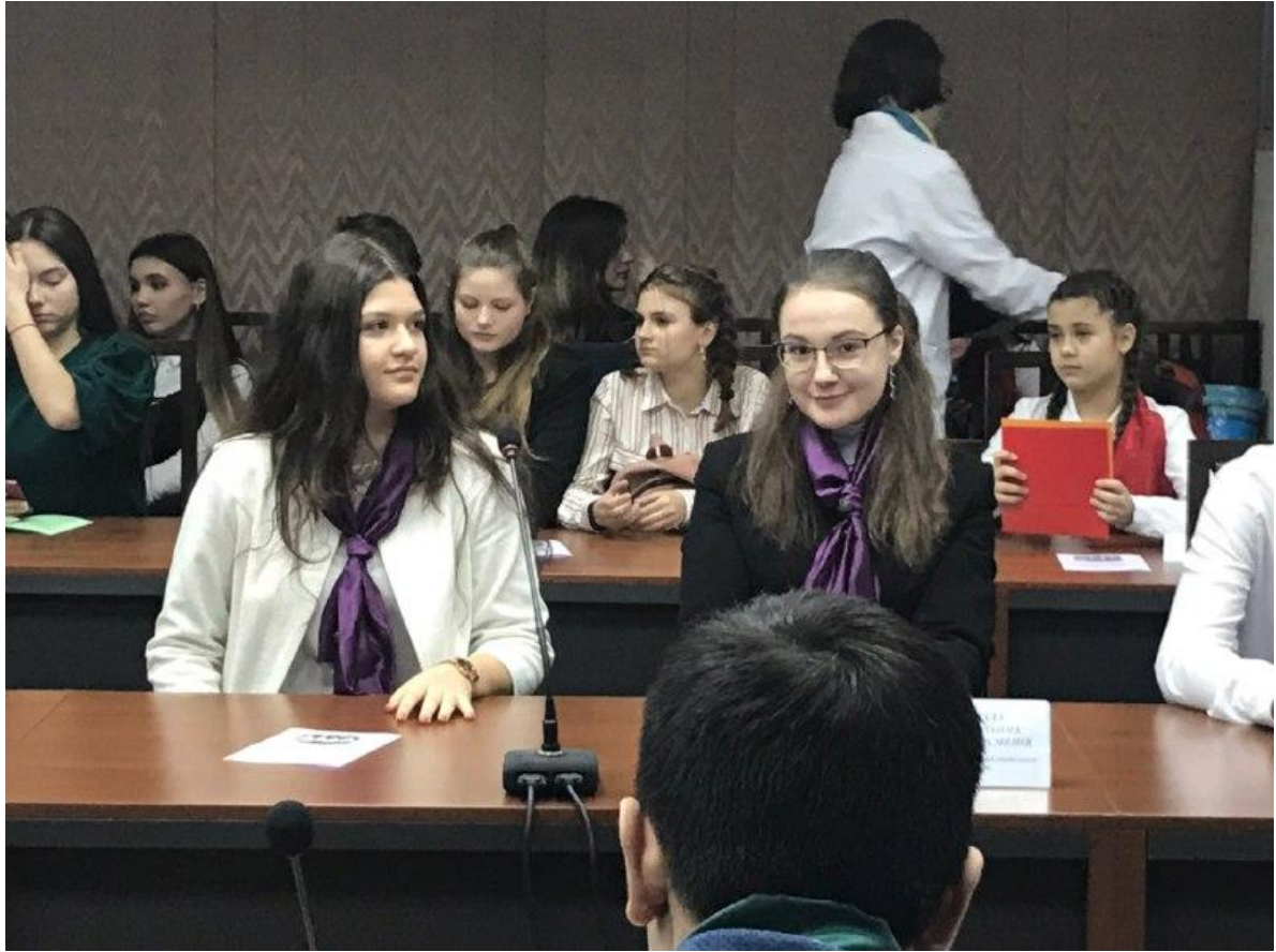
Рада шкільних омбудсменів