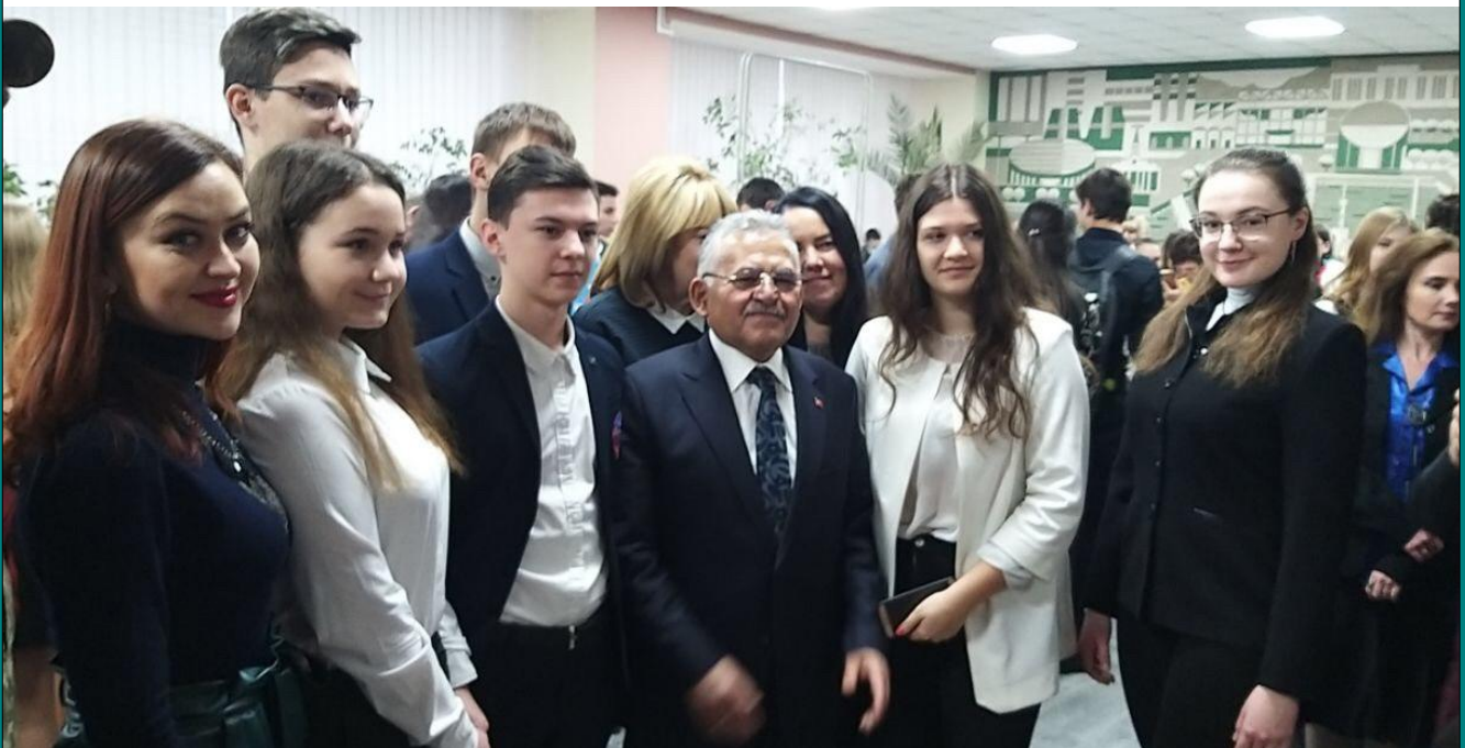
Фото з гостем заходу