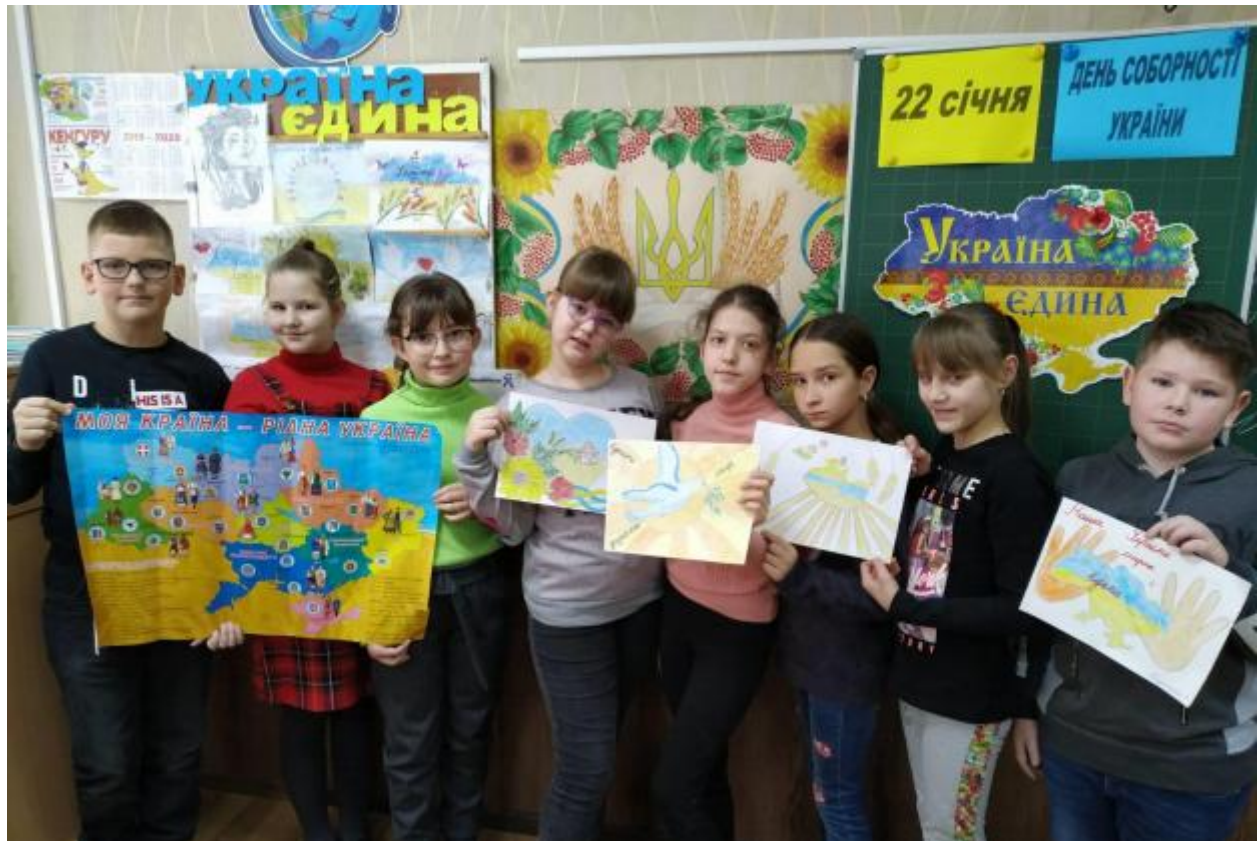
Виставка стіннівок та плакатів