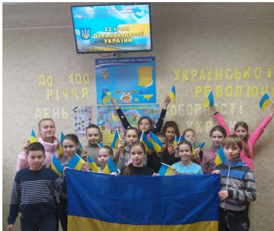
Виховна година "Україна Соборна - Україна Єдина"

День Соборності — свято України, яке відзначають щороку 22 січня в день проголошення Акту Злуки Української Народної Республіки й Західноукраїнської У цей день прийнято також згадувати іншу подію, яка відбулась рівно на рік раніше 22 січня 1918 р. - прийняття IV Універсалу УЦР, яким проголошувалася повна незалежність УНР В школі було заплановано та проведено заходи щодо відзначення Дня Соборності України: