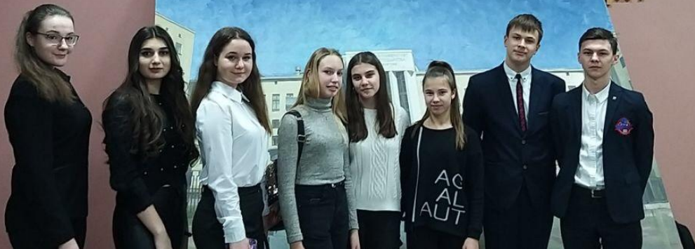
Перед початком виставки

ШАНУЙТЕ СВОЙ УНІВЕРСИТЕТ, БЕРЕЖІТЬ ЙОГО ЧЕСТЬ ТА ПРИМНОЖУЙТЕ КРАЩІ ТРАДИЦІЇ!