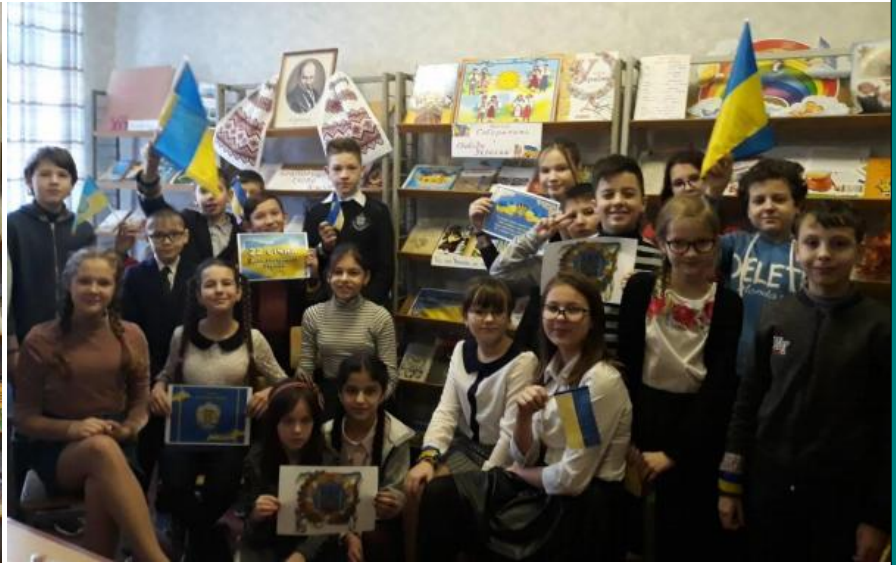
Виставка у шкільній бібліотеці