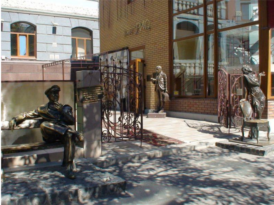
Мистецтво з гумором