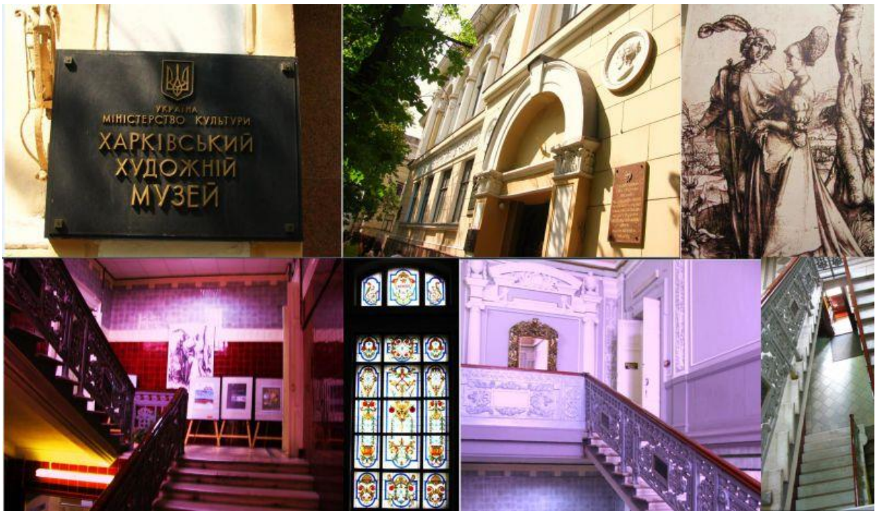
Харківський художній музей