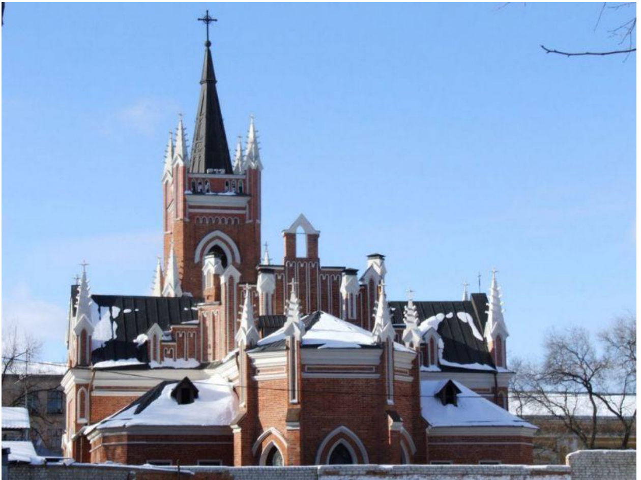
Католицький собор Собор Успіння