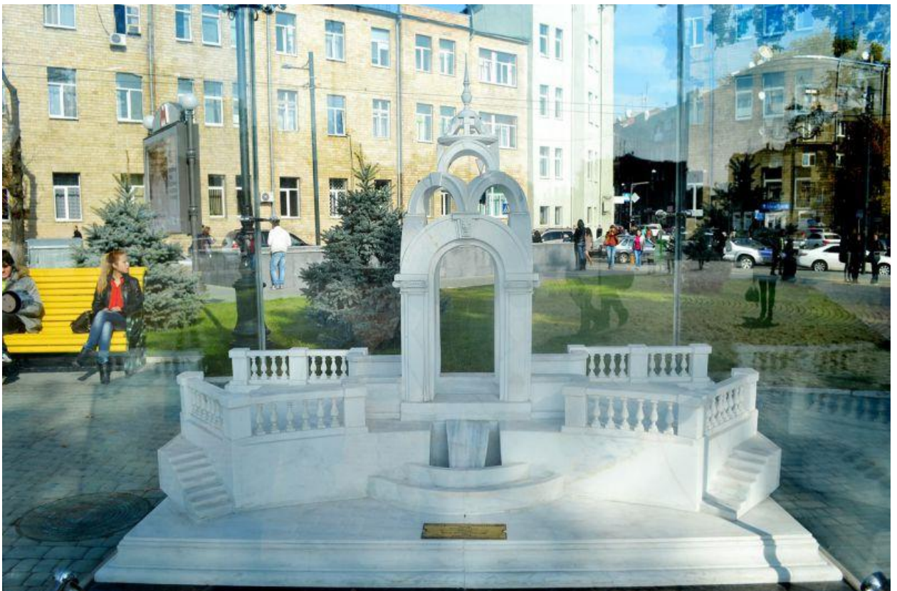
Площа Архітекторів Сім чудес Харкова