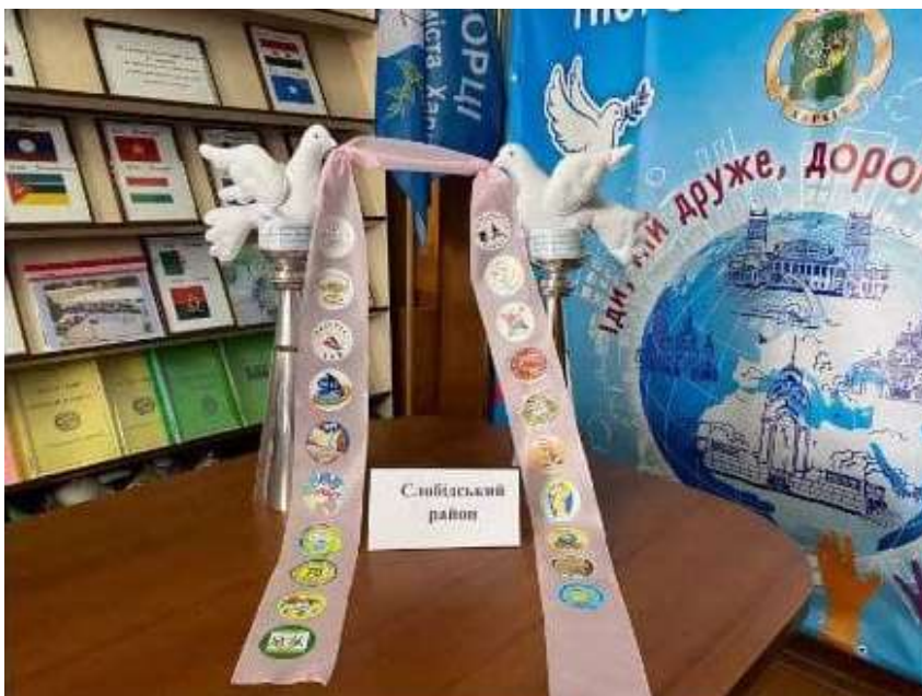
Робота Слобідського району

15 квітня, через платформу «Zoom», пройшло презентування робіт акції «На крилах миру», у якій приймав участь наш рідний Слобідський район. Мета конкурсу полягала у популяризації ідеї миру, добра, довіри, виховання у дусі миротворчості та демократичного світогляду учнів закладів освіти міста Харків. На фото, представленому нижче, ви можете спостерігати проект, який був представлений нашим районом.