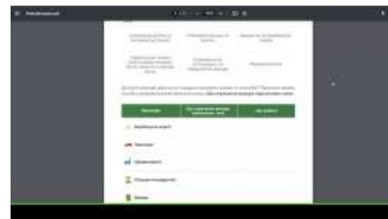
Гра запропонована амбасадорами